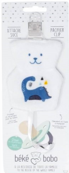
ASO4 Attaché suce Dinos Minimum Qty : 1