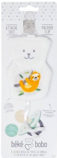
ASO1 Attaché suce Paresseux Minimum Qty : 1