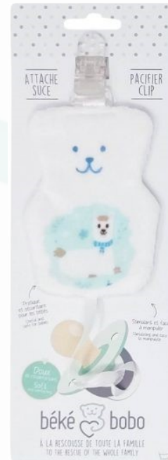
ASO3 Attaché suce Lama Minimum Qty : 1