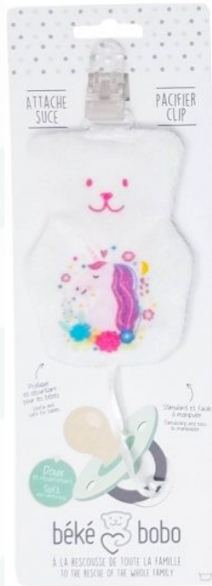
ASO2 Attaché suce Licorne Minimum Qty : 1