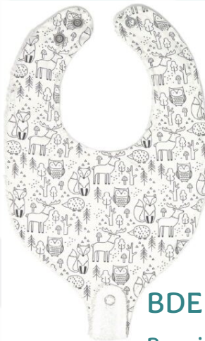
BIDENT1 Bavoir dent. Harmonieux Minimum Qty : 1