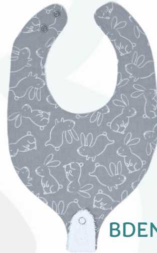
BIDENT2 Bavoir dent. Enjoué Minimum Qty : 1