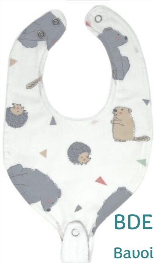
BIDENT4 Bavoir dent. Douillet Minimum Qty : 1